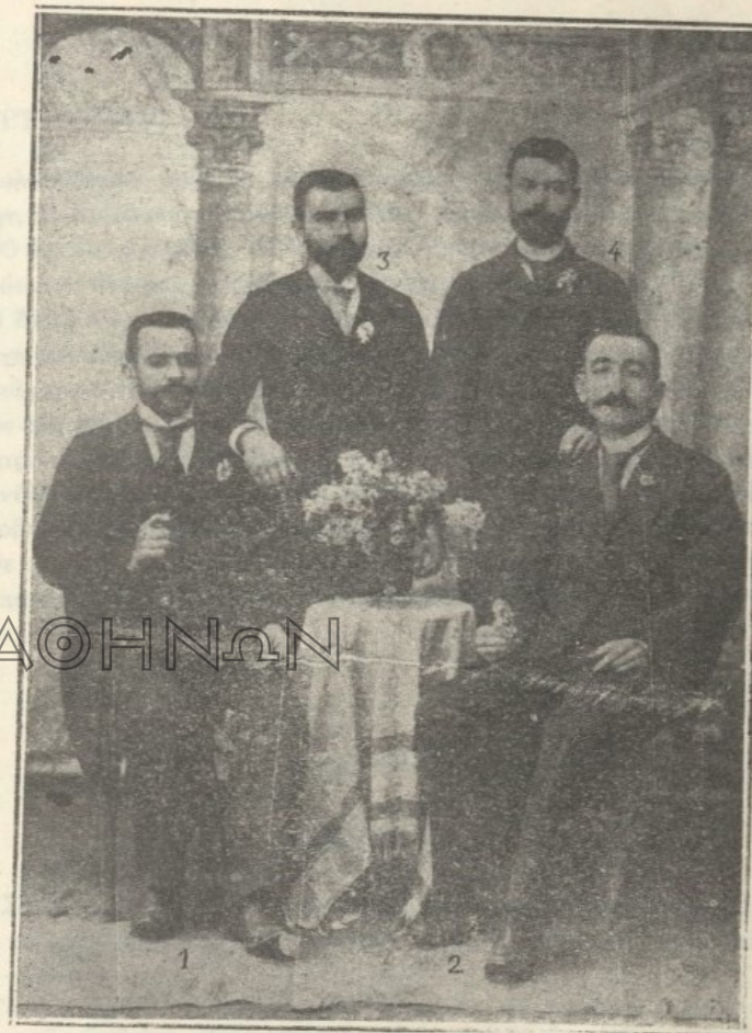
Τὸ κατὰ τὸ σχολικὸν ἔτος 1895 96 διδάξαν προσωπικὸν ἐν τῷ ἄρρεναγωγείῳ Κεσσάνης.