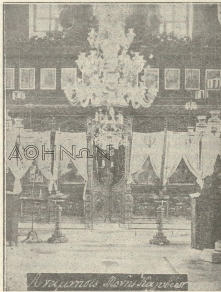
(Φωτογραφία ληφθεῖσα τῇ 1904 ἐπὶ ἡγουμένου Κλεόπα).