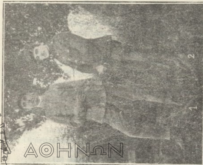
Κεσσανεὶς ὑπηρετοῦντες παρὰ τῷ ἑλληνικῷ στρατῷ.