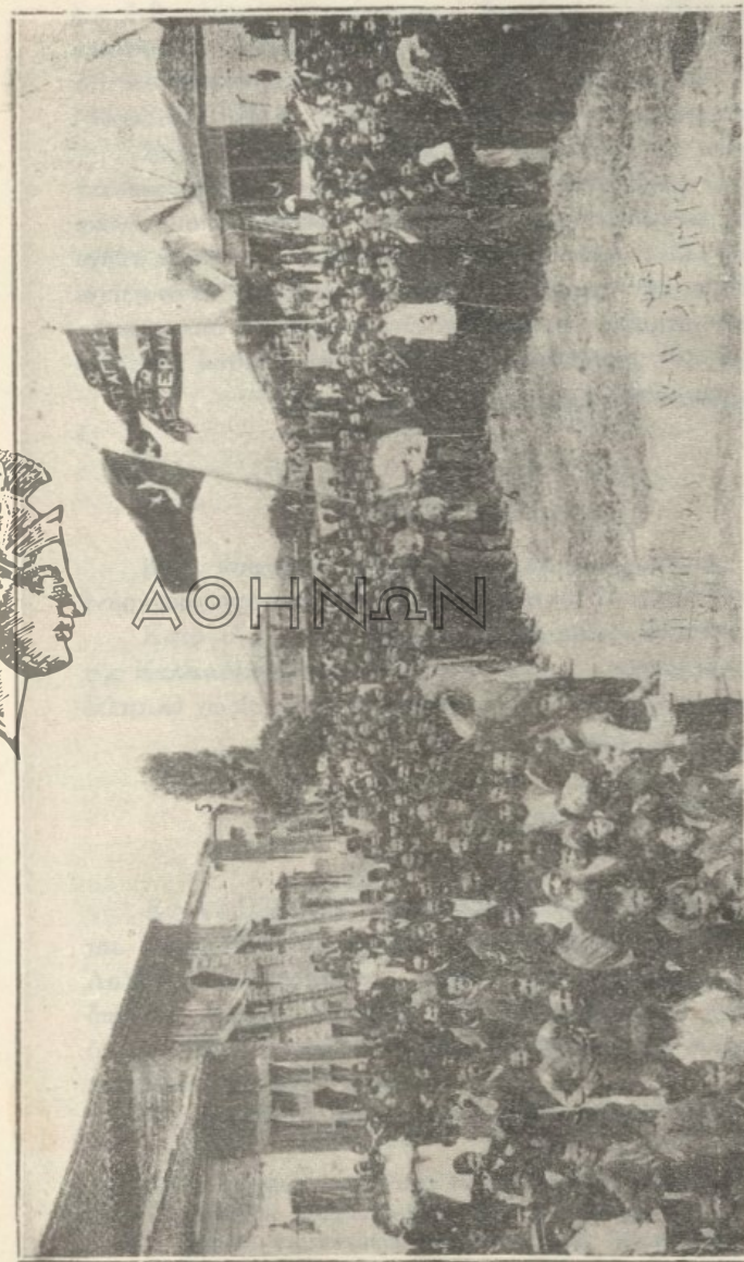
Ἕλληνες Κεσσανεῖς μετὰ τοῦ Θεοφιλεστάτου ἐπισκόπου Ναζιανζοῦ καὶ Ἰωάννου καὶ Τεῶρων ἀξιωματικῶν συνελθόντες τῇ 11/24 Ἰουλίου 1908, ἡμέρᾳ Παρασκευῇ, ἵνα διαδηλώσῃ τὴν ὑπερεκθειλίσεισάν αὐτῶν χάριν καὶ τὸν ἀκράτητον ἐνθεουσιασμόν των ἐπὶ τῇ ἀνακρίσει τοῦ Συντάγματος.