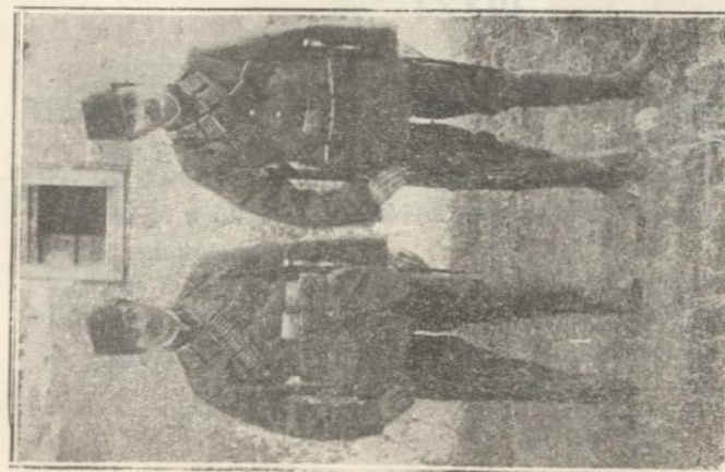
Κεσσανεὶς ὑπηρετοῦντες παρὰ τῷ τευρκικῷ στρατῷ.