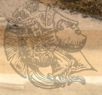
Κεβάλας - Νοσοκομείον ὁ Εὐαγγελισμὸς