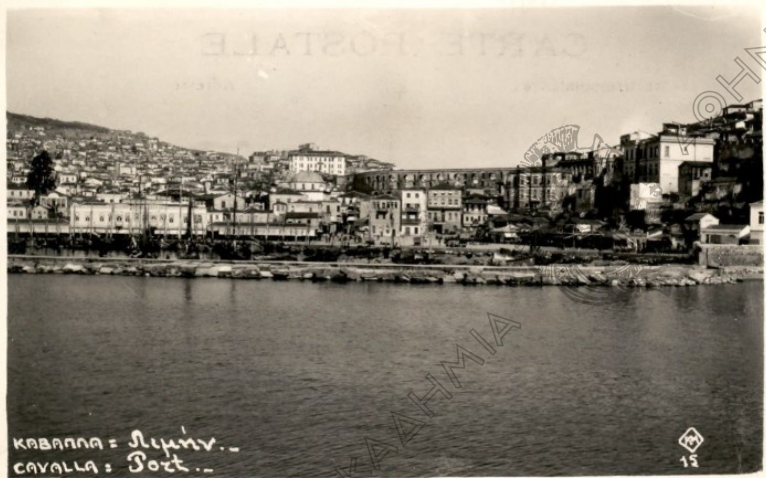
ΚΑΒΑΛΑ = λιμνί - CAVALLA = Port -

Τηλεγραμμική Διεύθυνσις : απόσπασμα - Σηταβόταν.