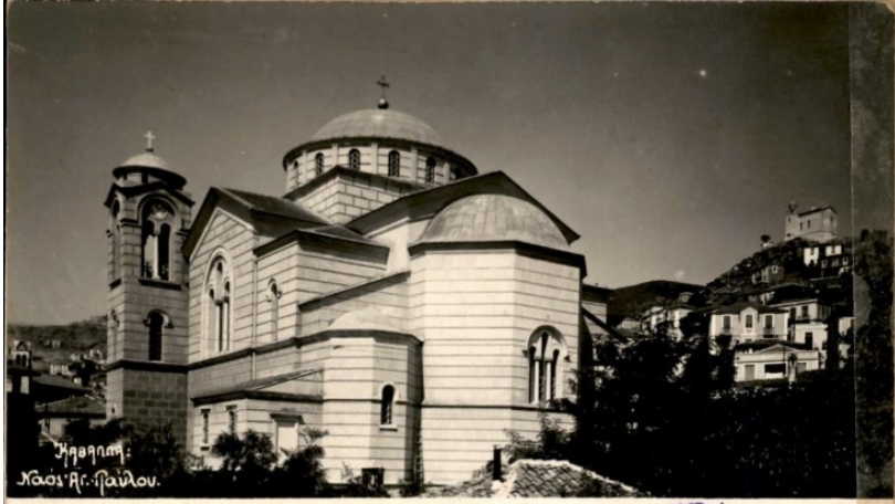
Μνημείο: Χώρα Αγ. Παύλου.