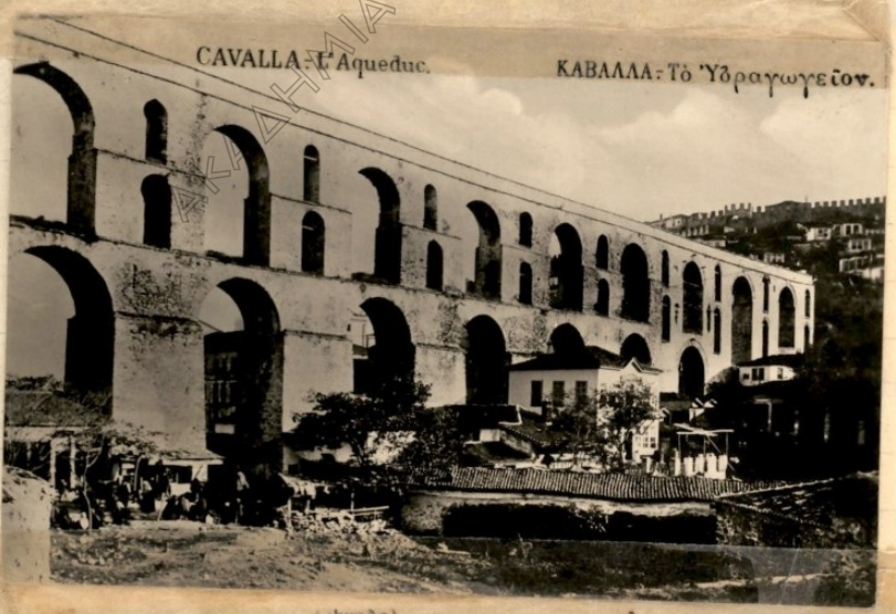
CAVALLA - L'Aqueduc.