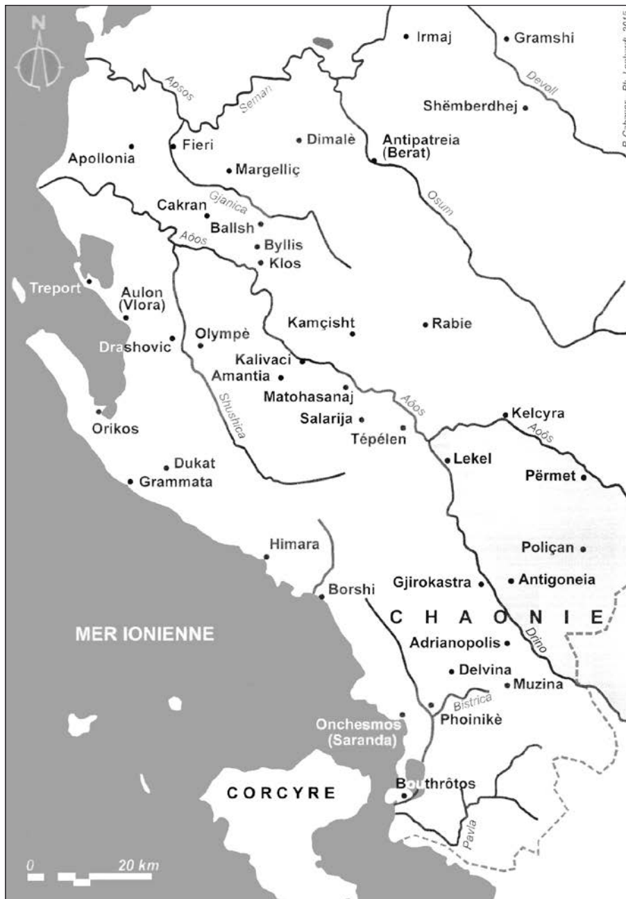
Χάρτης 1. Αρχαίες πόλεις και αρχαιολογικές θέσεις στην Βόρειο Ήπειρο και Νότιο Αλβανία.