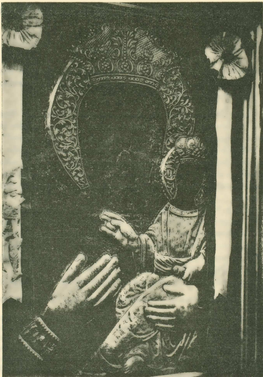
Εἰκ. 1. — Ἡ εἰκὼν τῆς Παμμακαρίστου τοῦ Πατριαρχικοῦ ναοῦ Κωνσταντινουπόλεως. Πρὸ τοῦ καθαρισμοῦ.

καθαρισμοῦ τῶν διὰ βερνικίου ἐπιχρισμάτων ἀνεφάνη ἡ ἀρχικὴ σχεδὸν ὄψις τῆς ἀξιο-