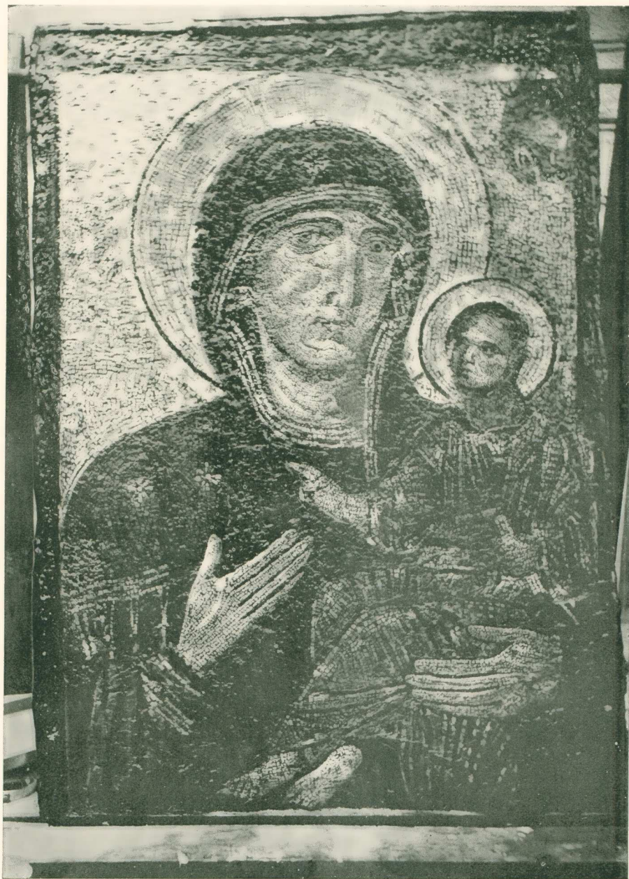
Εἰκ. 2.—Ἡ εἰκὼν τῆς Παμμακαρίστου τοῦ Πατριαρχικοῦ ναοῦ Κωνσταντινουπόλεως. Μετὰ τὸν καθαρισμόν.