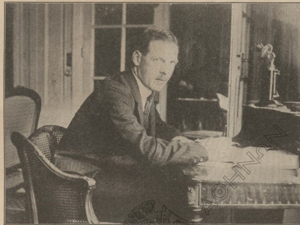
Ο ΒΑΣΙΛΕΥΣ ΑΛΕΞΑΝΔΡΟΣ ΕΝ Τῷ ΓΡΑΦΕΙῳ ΤΟΥ ΟΛΙΓΟΝ ΠΡΟ ΤΟΥ ΜΟΝΗΑΙΟΥ ΑΤΛΑΝΤΙΣ

τῆς ἀρχῆς τῆς νέας ζωῆς τῆς μεγαλυνοθείας 'Ελλάδος ἀπαιτεῖ τὴν ὁμόνοιαν ὅλων ἑλλοι τοῦ 'Εθνους, οὗ ἄς κληθῇ καὶ πάλιν συνταγματικὸς ἡγέτης ὁ μόνος νόμιμος κάτοχος καὶ προσφιλεὶς εἰς τὰς καρδίας ὅλων τῶν 'Ελλήνων ἐνδοξος Βασιλεὺς Κωνσταντῖνος. «'Αρετὸν τῇ ἡμέρᾳ ἡ κακία αὐτῆς».