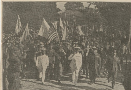
Ο ΛΑΟΣ ΤΗΣ ΠΑΙΔΕΣΤΗΣ ΠΡΟΣΕΧΟΜΕΝΟΣ ΤΟΝ ΒΑΣΙΛΕΑ ΑΛΕΞΑΝΔΡΟΝ

Ἡ ἐπαισιότερα ἡμέρα τῶν περιηγήσεων τοῦ 'Αλεξάνδρου ἀνὰ τὴν Θράκην ἔπαυσε ἡ Δευτέρα, 17 'Ιουλίου, καθ' ἣν ἐπρόκειτο νὰ εἰσέλθῃ ἐπίσημος εἰς τὴν 'Αδριανούπολιν ὁ Βασιλεὺς τῶν 'Ελλήνων. Ἡ ἱστορικὴ πρωτεύουσα τῆς Θράκης ἦτο καταστῆλας ἀπὸ 'Ελληνικὰς σημαίας. Οἱ κάτοικοι ἀπὸ πρῶας εὐρίσκοντο ἐν συναγερμῷ. Τὰ καταστήματα καὶ τὰ κέντρα ὅλα ἤσαν κατὰ κλειστά. Ὁ λαὸς ἐώρασε τὴν ἐορτὴν τῶν ἐορτῶν καὶ τὴν πανήγυριν τῶν πανηγύρων. Κάτι τι ἀπερίγραπτον καὶ ἀσύλληπτον συνέβαινε τὴν ψυχὴν ἰδίᾳ