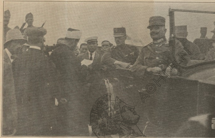
Ο ΤΟΥΡΚΟΣ ΜΟΥΦΤΗΣ ΠΡΟΣΕΦΩΝΟΝ ΤΟΝ ΒΑΣΙΛΕΑ ΕΙΣ ΤΑΣ ΣΑΡΑΝΤΑ ΕΚΚΛΗΣΙΑΣ

Τὴν ἐνδεκάτην ὥραν ὑπὸ τὰ στρατιωτικὰ προστάγματα καὶ τὰ ἐμβατήρια τῶν μουσικῶν εἰσῆλθετο ὁ Βασιλεὺς ἐπ' αὐτοκινήτου, ἔχων ἀριστερὰ τὸν στρατηγὸν Ζυμβρακίην. Ἀκολουθοῦν τ' αὐτοκίνητα τοῦ Ὑπάρχου Ἀρμυστοῦ μετὰ πολλὴν διπλωμάτου καὶ τῶν ὑποστρατηγῶν ὑπαπιστῶν τοῦ Βασιλέως. Τὴν ὕλην πομπὴν κλείουν ἀξιωματικοὶ καὶ οὐλαμὸς ἵππικῶν.