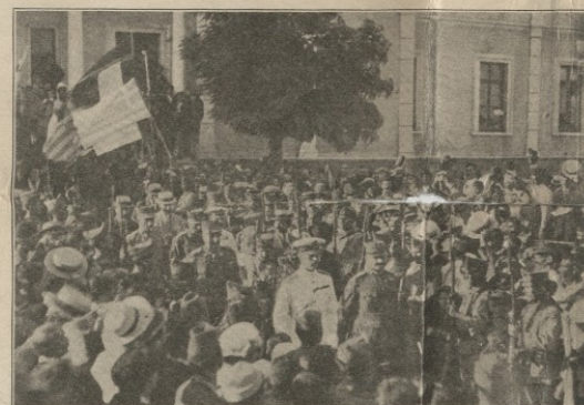
Η ΕΝΘΟΥΣΙΑΣΜΟΣ ΠΡΟΣΧΗ ΤΟΥ ΑΛΕΞΑΝΔΡΟΥ ΕΙΣ ΤΗΝ ΠΑΙΔΕΣΤΗΝ