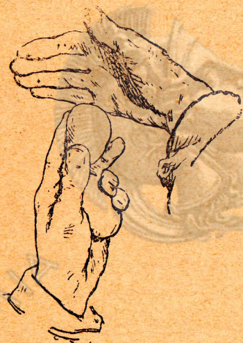
Κύταγμα τοῦ αὐγοῦ

Γιὰ νάχετε καλὲς κόττες, πρέπει νὰ φροντίζετε τὰ αὐγά τῆς κλώσσας νάσαι καλοσηματισμένα καὶ φρέσκα, δηλαδή ὡς 7 ἡμερῶν τὸ καλοκαίρι καὶ ὡς 12 τὸ πολὺ ἡμερῶν τὸ χειμῶνα. Ἐξ ἄλλοι γιὰ νὰ εἶσθε βέβαιοι πόσα αὐγά θὰ βγάλῃ ἡ κλώσσά σας χρειάζεται ὑστερα ἀπὸ 5 μέρες κλωσσήματος, μέσα σ' ἓνα τελείως σκοτεινὸ δωμάτιο, πού θὰ ἔχετε ἀνάψει μιὰ λάμπα, νὰ ἰδῆτε ἂν ἔχουν ὅλα τ' αὐγά σπόρο.