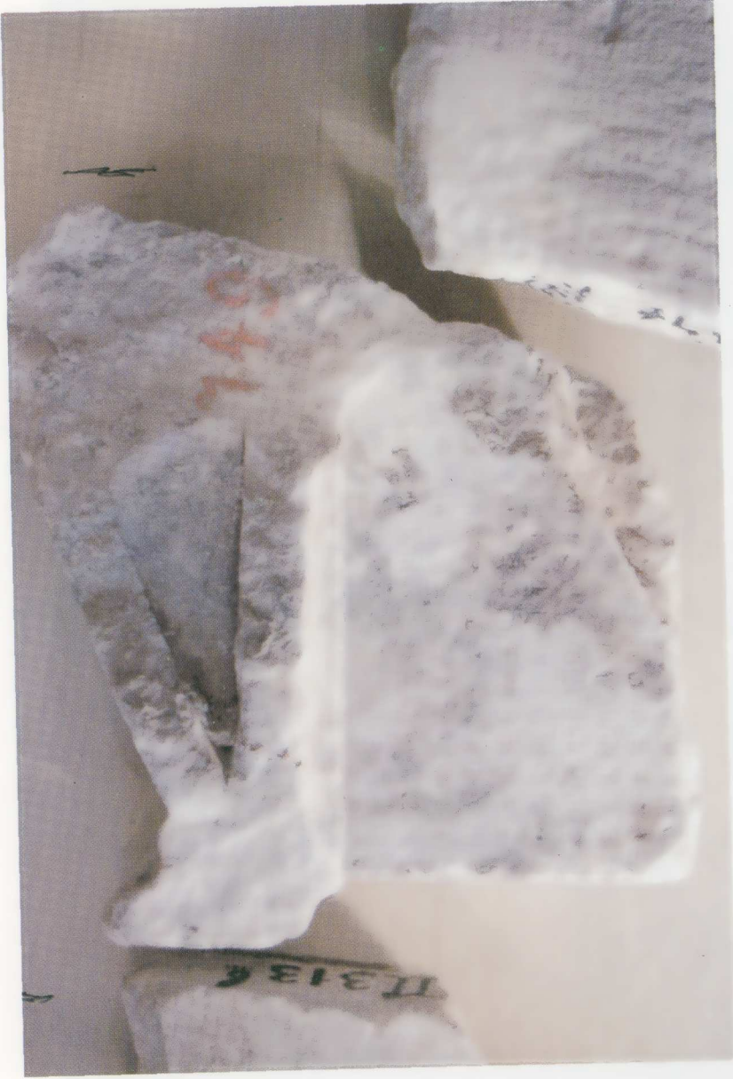
Plate 1. A typical fragment of a stone stèle from the third century BC (Epigraphical Museum, Athens).