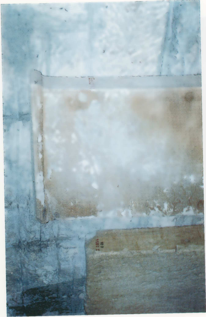
Plate II. A badly worn stèle from the excavations in the Athenian Agora ( Agora Inv. I 6793 = Agora XVI no. 84).