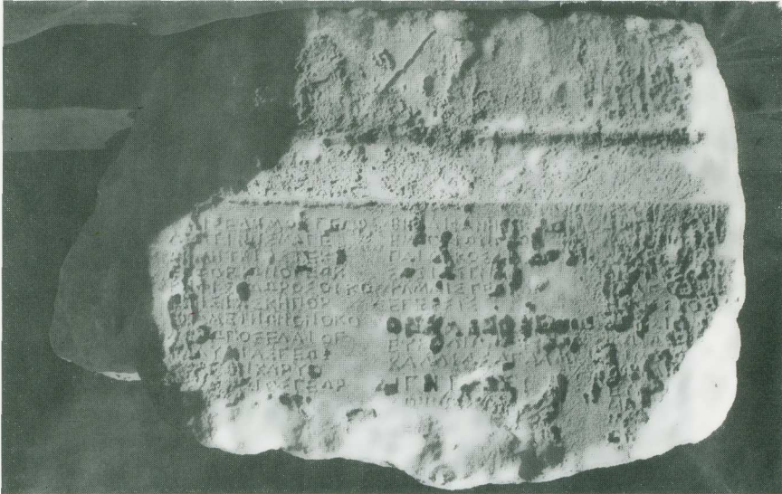
Plate III. The front surface of the upper part of the stèle containing the record of the honours decreed for the foreigners who fought at Phyle-the «Phyle Decree» (see note 11).