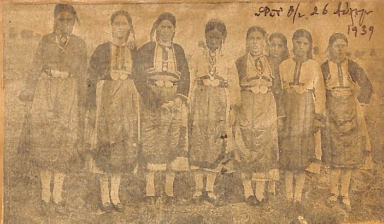
Με εθνογραφικὴν αὐτοὺν κόσμον εἰς τὴν Κομοτηνὴν. Δεξιά. Χωριατοπούλες τῆς Γρατινῆς στο πανηγύρι. πρὸ Φαειρ Παναγιώτου ἰχθυόσαν.