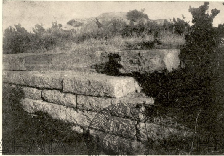
Εἰκ. 2. Τοῖχος ἐπὶ τῆς κορυφῆς τῆς ἀκροπόλεως τῆς Οἰούμης.

τούτων ἐν τῇ τάφρῳ εὐρέθησαν ἕξ ὡτα ἐσφραγισμένα ἀμφορέων δξυπυθμέ- νων, τοῦ εἴδους δηλαδὴ τοῦ χαρακτηριζόντος ὀλόκληρον σχεδὸν τὴν ἀπέναντι