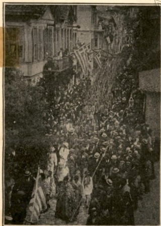
Ο ΜΗΤΡΟΠΟΛΙΤΗΣ ΣΗΛΥΒΡΙΑΣ ΕΠΙ ΚΕΦΑΛΗΣ ΤΟΥ ΑΠΕΛΕΥΘΕΡΩΣΑΝΤΟΣ ΤΗΣ ΠΟΛΙΝ ΣΤΡΑΤΟΥ

Τὴν ἐπομένην, ἀτιμώλοισιν σηματοστάτιστον