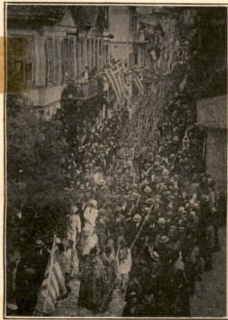
Ο ΜΗΤΡΟΠΟΛΙΤΗΣ ΣΗΛΥΒΡΙΑΣ ΕΠΙ ΚΕΦΑΛΗΣ ΤΟΥ ΑΠΕΛΕΥΘΕΡΩΣΑΝΤΟΣ ΤΗΝ ΠΟΛΙΝ ΣΤΡΑΤΟΥ

Τὴν ἐπομένην, ἀτιμώλοισιν σηματοστάτιστον