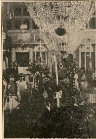
ΚΕΝΟΤΑΦΙΟΝ ΕΝ ΤΡΕΙΣ ΚΩΜΟΠΟΛΕΩΣ ΤΗΣ ΣΗΛΥΒΡΙΑΣ ΔΙΑ ΤΟΥΣ ΠΕΡΙΟΙΚΟΥΣ ΣΤΡΑΤΩΤΑΣ

Ἡ Σηλυβρία σύσσωμος μετὰ χαρᾶς τοὺς ἐπεδέχθη, καὶ εἰς τὸν κήρον τῆς Ἐλευθερίας (τὸ