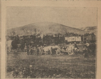
1 Ο ἐκτελισμὸς τῶν Θεακῶν

Μετα τὴν ὄψιν τοῦ λειψάνου εἰσε- λθὼν τὸν β. στρατιώτη, οὐ βου- λόμενος διαμαρτυρεῖται καὶ ἰσχυ- ρῶς συνεισφέρει ὡς ἐνὸς στρα- τιώτου, κατεβιβάζοντα ἐπὶ τὸν ἐλλείποντα πληρώσειν καὶ ἐρησι- αὶ ἐν ἐκκλησίᾳ τοῦ ἀρχαίου τοῦ μεγαλοκτίτου στρατιωτοῦ· καὶ παράδειξον τῆς Ρωμαιοῦ. Ἡσυχία