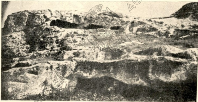
Τὸ «Παλιὸ» ὑπερθεν καὶ πλαγίως τοῦ ναοῦ.

8.— Πότε παρέλαβον οἱ Ἀρμενιοὶ τὸν ναὸν τοῦτον— ἐπίσημα Κυβερνητικὰ ἔγγραφα. Ἡ φήμη ὅτι δῆθεν ὁ Ἅγιος Γεώργιος ἐπωλήθη εἰς τοὺς Ἀρμενίους εἰκονικῶς ἀντὶ 175 γροσίων τὸ ἔτος 1795 (1) εἶνε ἀστήρικτος. Ὑπάρχει ἀπόδειξις, ὅτι οἱ Ἀρμενιοὶ εἶχον τὸν ναὸν τοῦτον καὶ πρὸ τοῦ ἔτους ἀκόμη 1704. Διότι ἐν τῷ ἀλλοθῶρῳ αὐτοῦ δια-