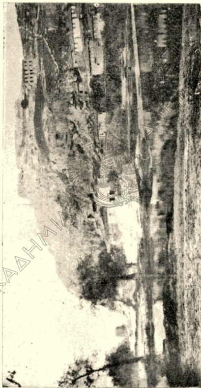
Ἐν δεξιᾷ, ὁ κατεδαφισθεὶς παλαιὸς ξενὼν, ὅπουθεν αὐτοῦ δυσδιόρατος ὁ ναὸς καὶ τὸ «Παλαίον». Ἀριστερὰ μετὰ τῶν δένδρων, εἰς τὸ βάθος ὁ πύργος «Πεντάγωνον» (Μπέε-κούσακ).

Τὸ Μοναστήριον, ἐπειδὴ εἶχεν ἀνάγκην, ἐπιδιωρθώθη, ὥς ἔλεγεν ὁ Παπαζιάν, καὶ τὸ 1896 περίπου. Μετὰ ταῦτα ὁμοῦς ἡρειπώθη