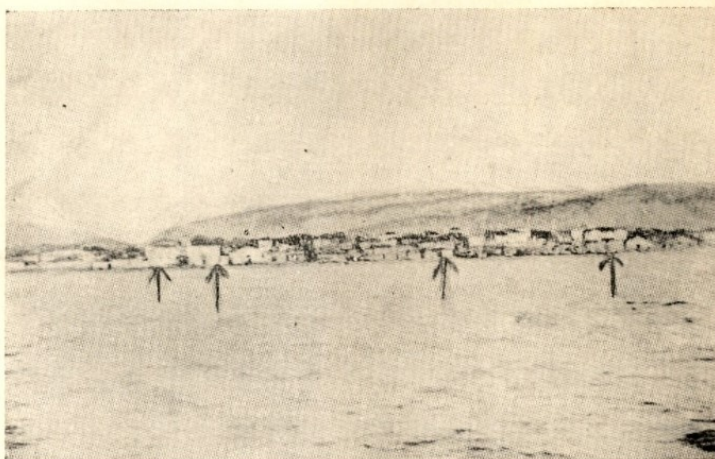
Ἡ Χώρα τῶν Γαλλοχωρῶν πρὸ τοῦ σεισμοῦ τοῦ 1912.