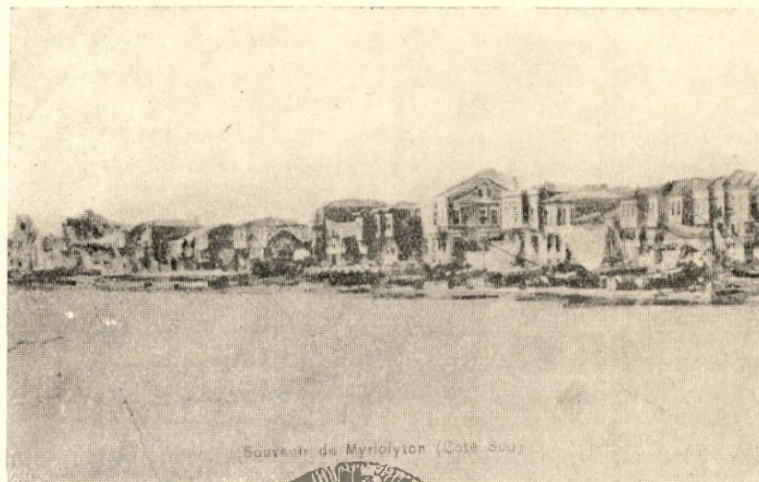
*Η νότιος παραλία του Μυτιλήνιου πρὸ τοῦ 1912.