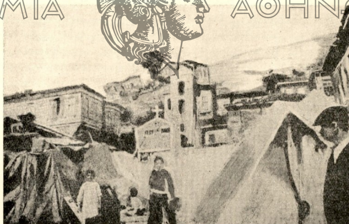
Κατασκηνώσεις εις τὴν παραλίαν Γάνου μετὰ τὸν σεισμόν τῆς 27 Ἰουλίου 1912.