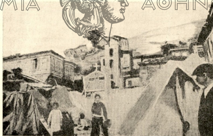
Κατασκηνώσεις εις τὴν παραλίαν Γάνου μετὰ τὸν σεισμόν τῆς 27 'Ιουλίου 1912.