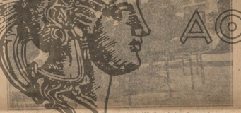
Ὁ θλῆθρος τῆς Καβάλας καὶ τὸ ἥθροισμα τῶν πενήτων.

Μετὰ τὴν ἐκδοσιν τῶν Φιλανθῶν καὶ τὴν ἀσφυκτικῇ καταστάσει τῶν 80.000 κατοίκων τῆς Καβάλας τὸν μαρασμόν καὶ τὴν ἀπογίνωσιν τῶν κατωτέρων κοινωνικῶν τάξεων πῶς πρέπει νὰ καταρολεμηθῇ ὁ βεβαίος θλῆθρος τῆς πόλεως