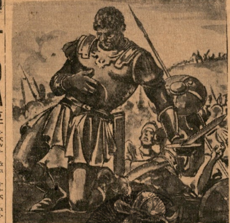
Κι' ό Σπάρτακος έπρεπε νά περνώ από τήν έξοχό του : «Χτυπάτε γιά τή λευτεριά μας»

Τραβάει προς τη Σικελία τό- ρα!... Μέσα στο πολυσύνθετο μυα- λό του βράζουν καινούργια σχέ- δια, νέα όνειρα αναπηδούν, νέες λαγνύρες ξεπροβάλλουν, θα κατα- φέρει να ξεγελήσει τους δούλους που σπάζουν έκει κάτω, θα κα- ταφέρει να φυσήσει στα σκλαβομέ- να στήθη των τό επαναστατικό α- ιστούς βράχους τό τρομερό της τρι- κυμίας τραγούδι και ως τ' αυτά του-θαρρεί πώς φτάνει εφιαλτική ή ήχο των ούρλιασμάτων, ό θρή- νος των άστρών που πίνονται. — Βίθεια, Σπάρτακε, γαίνω- στε!... *Όμως καμιά βοήθεια δέν μπο- ρεί νά δώση. Η Μοίρα τόν κρα-