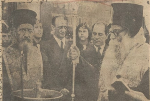
Η τέλεσις του αγιασμού υπό του Μητροπολίτου 'Αλεξανδρουπόλεως κ. 'Ιωακείμ. Διακρίνονται ο ύπουργός Γενικός Διοικητής Θράκης κ. Καλαντζής και ο νομάρχης 'Εβρου κ. Δ. Νόσχονας.