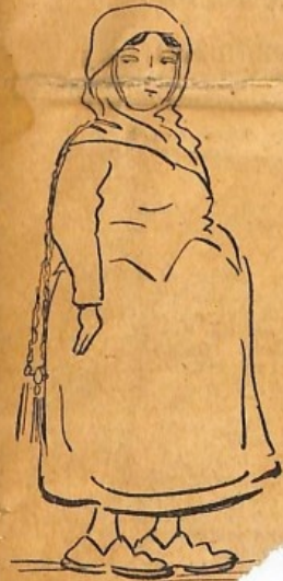
‘Η ‘Εθνική... παραγ... τους κάμποους της