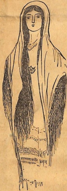
Τύπος προσφυγοπούλας, από της Βερροίας τὰ χωριά.

ΒΕΡΡΟΙΑ, Σεπτέμβριος.— Μιά ημέρα, με ένα δυνατό χιόνερο — το Βέρμιον ψηλά ασπίστηκε την νύχτα αυτή, με το πρώτο φτεινό του χιόνι — έπήγα εις τον συνοικισμό των εκ Κωστή «αναστενάρηδων», που είνε λίγο έξω της Μελίκης.