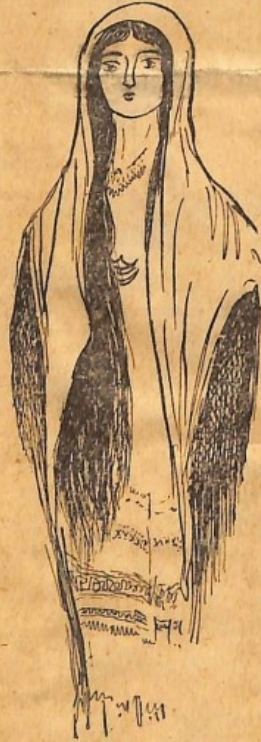
Τύπος προσφυγοπούλας, από της Βερροίας τα χωριά.

ΒΕΡΡΟΙΑ , Σεπτέμβριος. — Μιά ημέρα, με ένα δυνατό χιονόνερο — το Βέρμιον ψηλά άξπρίστηκε την νύχτα αυτή, με το πρώτο φετεινό του χιόνι — έπληγα εις τον συνοικισμό των εκ Κωστή «άναστενάρηδων», που εινε λίγο έξω της Μελίκης.