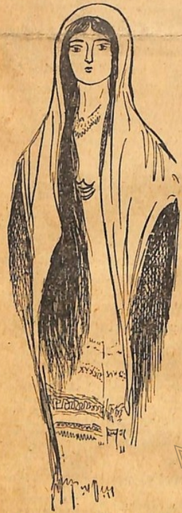
Τύπος προσφυγοπούλας, από τής Βερροίας τὰ χωριά.

ΒΕΡΡΟΙΑ, Σεπτέμβριος.— Μιά ημέρα, με ένα δυνατό χιόνερο — το Βέρμιον ψηλά άσπριστηκε την νύχτα αυτή, με το πρώτο φετεινό του χιόνι — έπήγα εις τόν συνοικισμόν τών εκ Κωστή «άναστενάρηδων», πού είνε λίγο έξω τής Μελίκης.