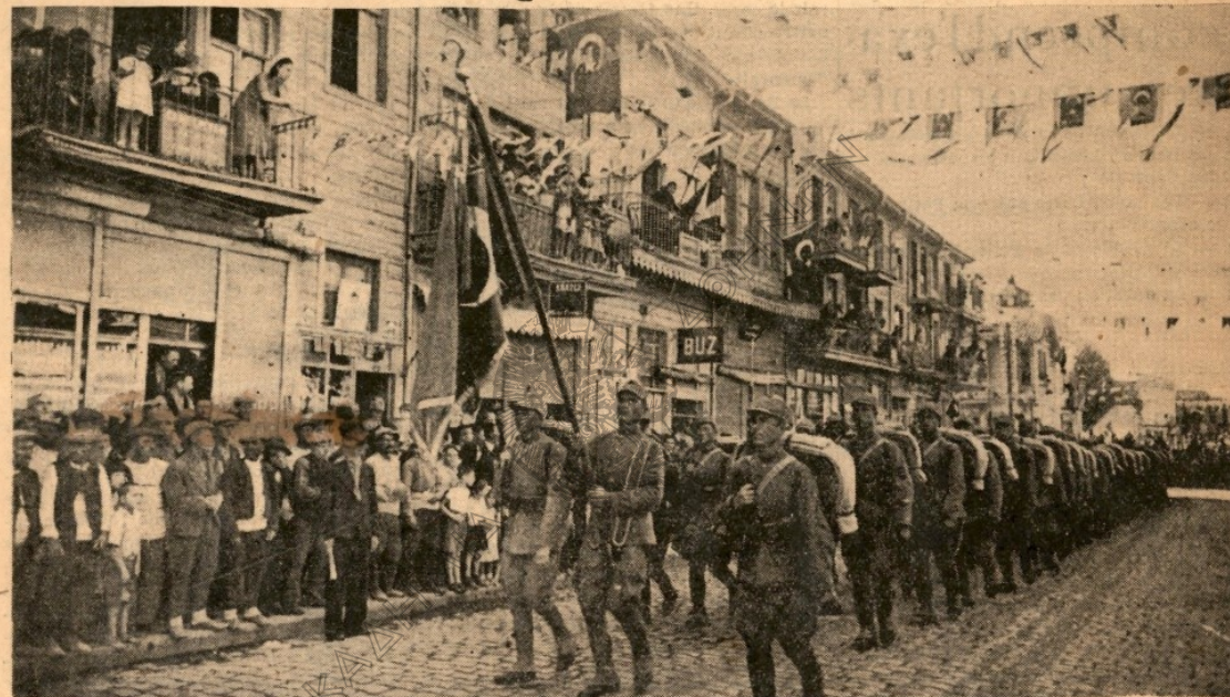
Nos détachements, le glorieux drapeau en tête, entrant à Edirné