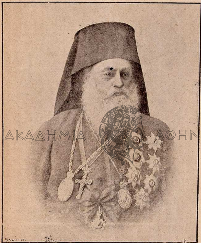
Ἡ Α. Θ. Π. ὁ Οἰκουμενικὸς Πατριάρχης ΙΩΑΚΕΙΜ ο Γ΄