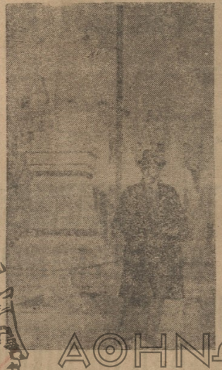
Ο ἄνδρῆς τοῦ Μουσταφᾶ Κεμάλ εἰς τὴν Πλατείαν τῆς Ραιδεστοῦ

Διερχόμεθα μερικὸς μικροσπειροῦς καὶ φθάνομεν εἰς τὸ Μουσταφῆ, τὸ ὁ- ποῖον εἶνε ὁ σταθμὸς τῆς Ραιδεστοῦ. Βασικὰ κατήλθον τῆς ἀμαρτυρο- χίας καὶ εἰσῆλθον εἰς τὸ πρῶτον καφε- νεῖον τὸ ὁποῖον συνήντησα. Ἀφοῦ ἀ- νεπαύθην ὀλίγον δὲν ἐβράδυνα νὰ εἴ- ρω ἐκεῖνο τοῦ ὁποῖου ἔχει ἀνάγκη ἕ- νας ταξιδιωτῆς. Κάποιος σωφὸρ ἐκά- λει τρεῖς ἐκ τῶν θαμῶνων τοῦ καφε- νεῖου, τοὺς ὁποίους εἶχε φέρει ἀπὸ τὴν Ραιδεστον καὶ ἐξήτει τὸν τέταρτον ἐ- παύσαν διὰ νὰ συμπληρώσῃ τὸ ἀγῶ- γι μου. Καὶ ὁ τέταρτος ἦμην ἐγὼ. Τὸ αὐτοκίνητον ἐκείνῳ μὲ μετρίαντα- χύτητα διὰ μέσου τοῦ ὄρειου δρόμου. Ἀπὸ τὸ παράθυρον διεκρίνω τοὺς με- γάλους στρατώνας, οἱ ὁποῖοι σήμερον εἶνε ἀρκετοὶ, καθόσον ἐξέλειπον ἤδη οἱ στρατηγικοὶ λόγοι διὰ τοὺς ὁποίους εἶχον ἀνεγερθῆ οὔτοι πρὸ τοῦ Βαλκα- νικοῦ πολέμου. Ἐνεθυμήθην ὅτι διὰ τὴν ἐπι- τὴν στρατῶνων αὐτῶν ἠκούσθησαν κισκερὴν τοῦ ὄρειου δρόμου καὶ ὁ ποῖον περνοῦσαμε. Ἐκεῖ ἠκούσθησαν εἰργασθῆσαν. Ἄλλοι ἠκούσθησαν ὅτι ἦτο γερμῶς ἀπὸ πρῶτον ἠκούσθησαν οἱ καὶ τῶρα παροῦσται ἐκεῖ ὅτι ἠκού- σθησαν ὅτι ἕνα ἀπὸ τῶν ἀρκετῶν ἐν καὶ τὴν μέγαν ἀρκετῶν ἐκεῖ ἠκού- σθησαν ὅτι ἕνα ἀπὸ τῶν ἀρκετῶν ἐκεῖ κατηφορικῶς. Καὶ ὁ πρῶτος ἠκού- σθησαν πρὸς τὴν θάλασσαν, τὸ πρῶτον γὰρ μαλακώτερο.