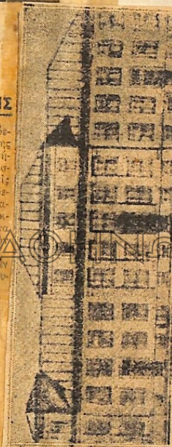
Ἰὰ νέα ἐλληνικά ἐκπαιδευτήρια ἐν Βουκουρεστίῳ

Αἱ ἐλλειψαὶ παροικίαι δὲν εἶναι δυνατόν να σβύσουν κι' οὕτε πρέπει νὰ τὰς ἀφήσῃ.